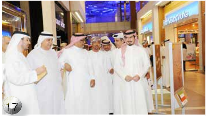
اختتام اجتماع وكلاء الآثار والمتاحف في دول المجلس بدولة الكويت