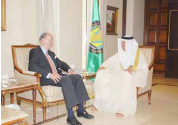
المرافق للمسؤول السويدي .

اجتمع معالي الدكتور عبد اللطيف بن راشد الزياني، الأمين العام لمجلس التعاون لدول الخليج العربية، بمقر الأمانة العامة، مع معالي فرانك بلفراج، نائب وزير الدولة للشؤون الخارجية بمملكة السويد، وذلك بمناسبة زيارته للمملكة العربية السعودية . تم خلال الاجتماع بحث سبل تعزيز العلاقات بين مجلس التعاون ومملكة السويد في كافة المجالات، كما تم استعراض آخر التطورات على الساحتين الإقليمية والدولية، بالإضافة إلى القضايا السياسية ذات الاهتمام المشترك. حضر الاجتماع سعادة سفير مملكة السويد لدى المملكة العربية السعودية السيد داج بوليند انفليت، وسعادة الدكتور سعد العمار، الأمين العام المساعد للشؤون السياسية، بالأمانة العامة، والوفد