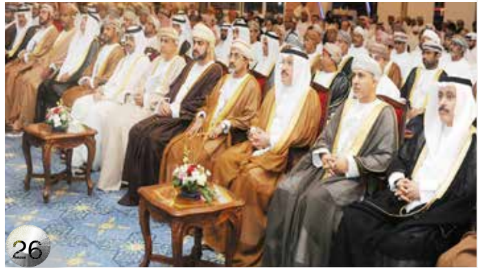
في اختتام مؤتمر الصناعيين الرابع عشر في مسقط توصيات بتبني سياسات واجراءات لتسهيل وانسياب الصادرات الخليجية لتعزيز التجارة البيئية