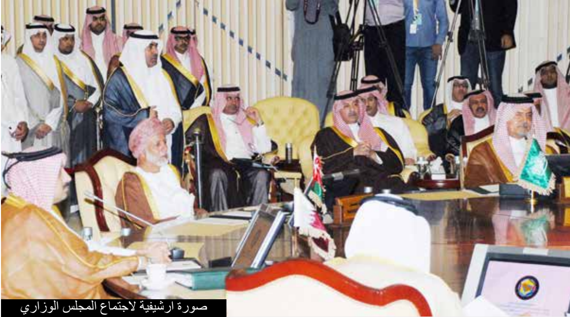
صورة ارشيفية لاجتماع المجلس الوزاري