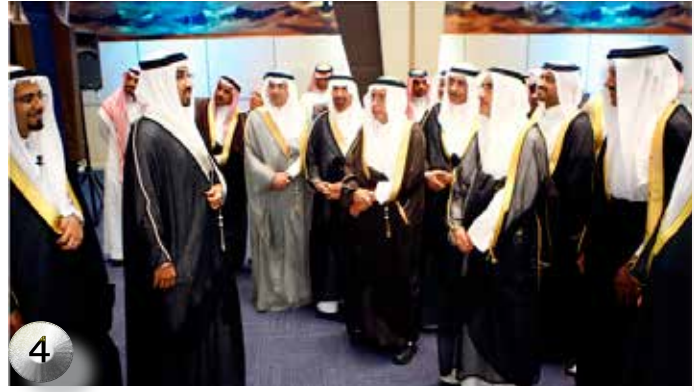
تدشين مقر هيئة الربط الكهربائي الخليجي بالدمام

الآراء والتقارير الواردة في هذه المجلة لا تعبر بالضرورة عن رأي الأمانة العامة لمجلس التعاون لدول الخليج العربية أو هيئة تحرير مجلة المسيرة