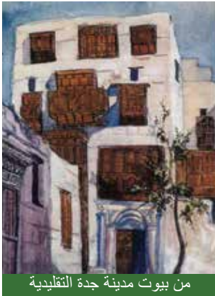
من بيوت مدينة جدة التقليدية