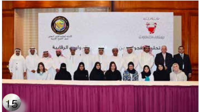
تنفيذ ورشة العمل حول تحليل الفجوات بين أنظمة العمل بالدواوين الرقابية ومتطلبات معايير الانترنسي في دول المجلس