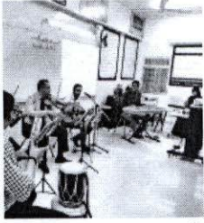
الأسبوع في صور